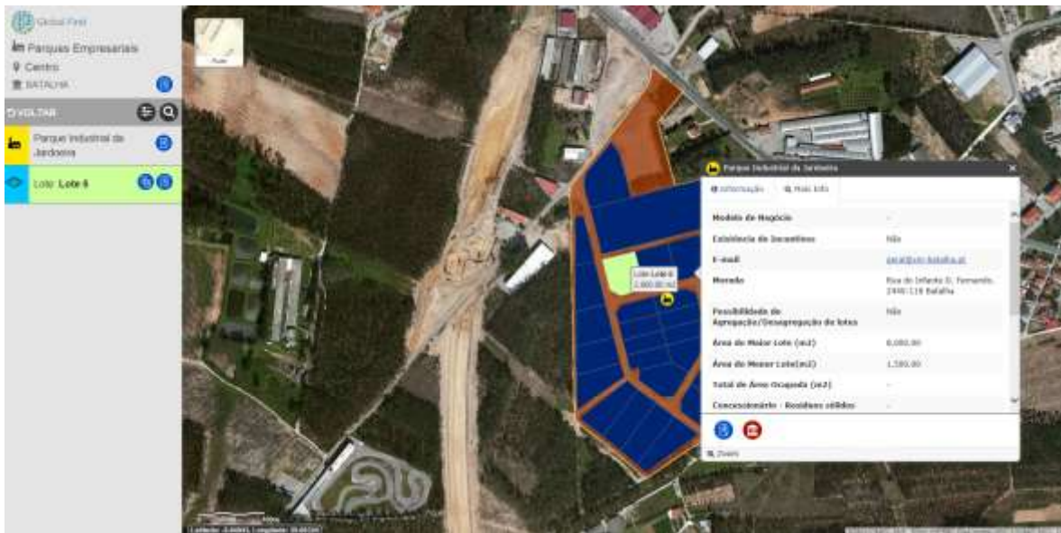
Exemplo de ecran do Global Find

A aicep Global Parques tem feito um grande esforço para aumentar a informação presente no Global Find, aspirando a cobertura do total nacional “Temos andando em “roadshow” apresentando a plataforma aos municípios através das Comunidades Intermunicipais e com o apoio da Associação Nacional de Municípios”, referiu o CEO da aicep Global Parques.