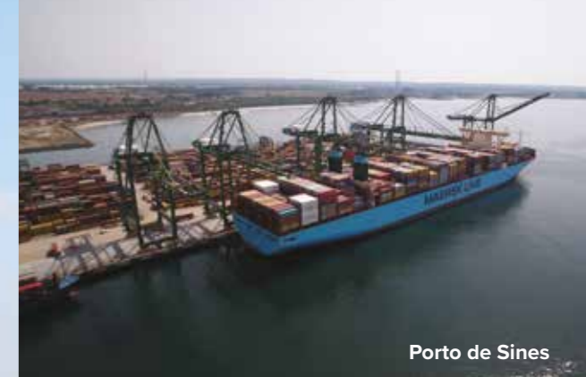
Porto de Sines