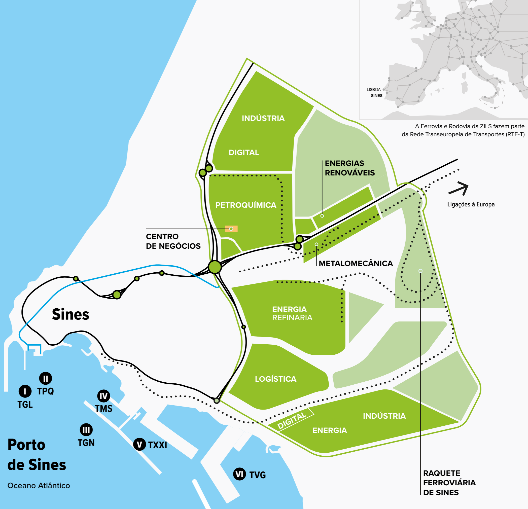
A Ferrovia e Rodovia da ZILS fazem parte da Rede Transeuropeia de Transportes (RTE-T)