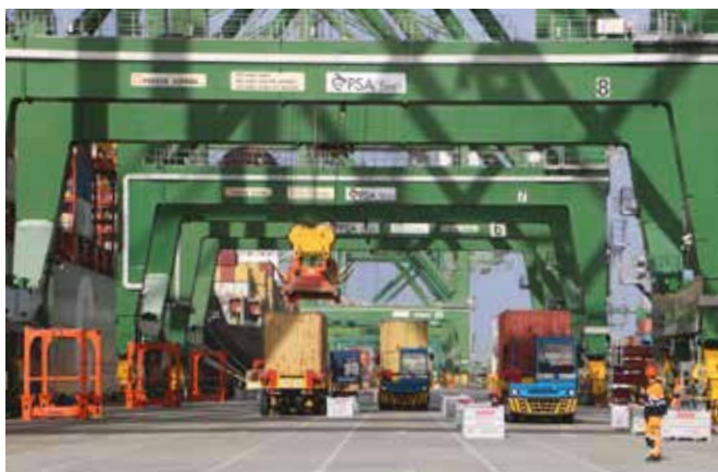
Porto de Sines.

Sines está localizado na costa Sudoeste portuguesa, junto à maior praia de areia branca da Europa (65 km). Usufrua de um país seguro com um ambiente social amigável, com um clima mediterrâneo, com 3.000 horas de sol por ano, excelentes infraestruturas de saúde e educação.