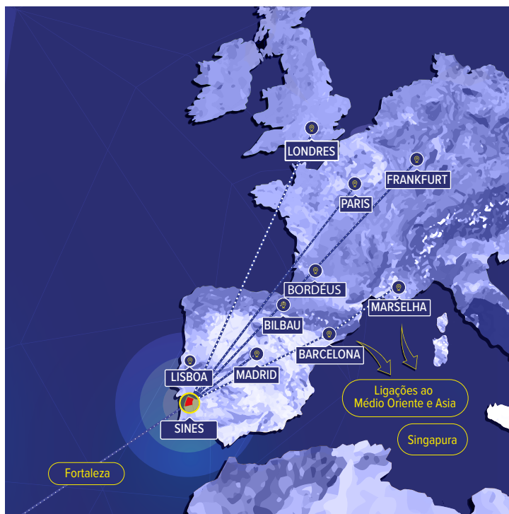
Imagem das ligações à Europa.

O Complexo Portuário, Logístico e Industrial de Sines tem o maior porto de águas profundas da costa Atlântica da Península Ibérica. Oferece uma ligação segura e de alta velocidade com rotas de baixa latência, capazes de hospedar projectos de IT&T e Data Centers.