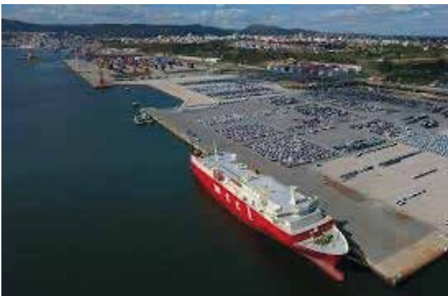
Porto de Setúbal

Setúbal, está localizada na foz do rio Sado, junto à maior praia de areia branca da Europa (65 km) e de notáveis infraestruturas de lazer – Troia e Comporta. Usufrua de um país seguro com um ambiente social amigável, com um clima mediterrâneo, com 3.000 horas de sol por ano, excelentes infraestruturas de saúde e educação, incluindo escolas internacionais.