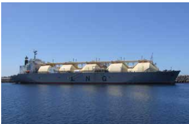
Porto de Sines.

Sines está localizado na costa Sudoeste portuguesa, junto à maior praia de areia branca da Europa (65 km). Usufrua de um país seguro com um ambiente social amigável, com um clima mediterrâneo, com 3.000 horas de sol por ano, excelentes infraestruturas de saúde e educação.