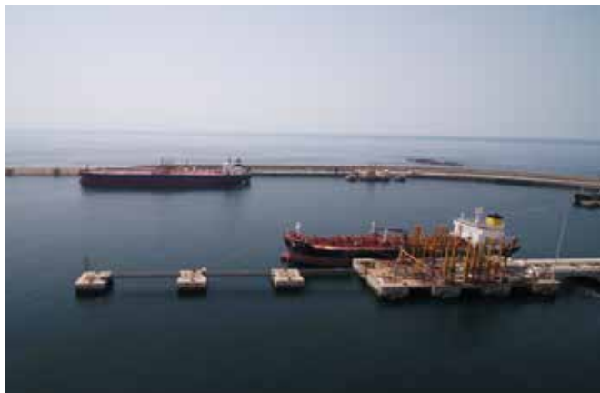
Porto de Sines.

Sines está localizado na costa Sudoeste portuguesa, junto à maior praia de areia branca da Europa (65 km). Usufrua de um país seguro com um ambiente social amigável, com um clima mediterrâneo, com 3.000 horas de sol por ano, excelentes infraestruturas de saúde e educação.