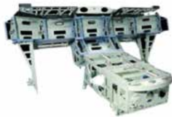
Pieza de la cabina del Airbus 350 fabricada por Lauak Portuguesa

Lauak, una empresa productora de equipos aeronáuticos, se instaló en BlueBiz en agosto de 2008 y ha incrementado constantemente desde entonces su negocio, la superficie ocupada y el número de empleados