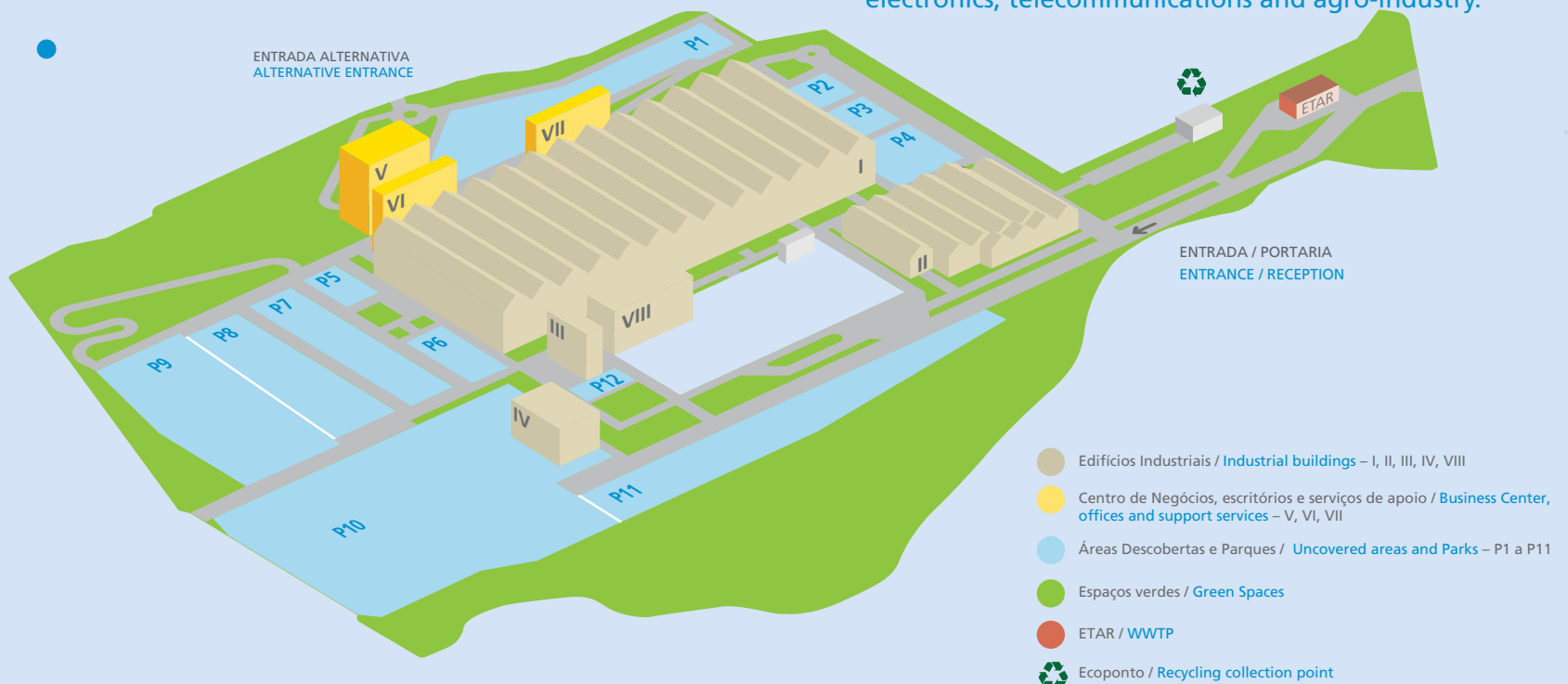
MAPA GERAL GENERAL PLAN