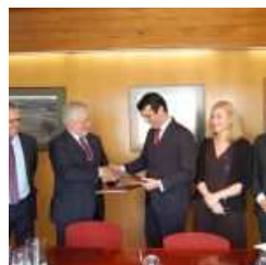
Medway investe um milhão na ZIL