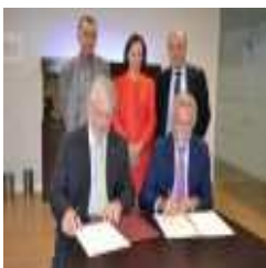
MSC e Medway posicionam-se na