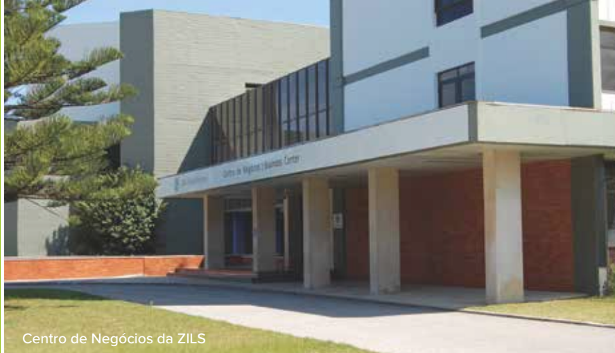
Centro de Negócios da ZILS

O Centro de Negócios da ZILS, tem toda a estrutura física e humana orientada para facilitar o sucesso do seu negócio. Potencia a criação de sinergias entre empresas e permite uma fácil instalação com total controle de custos.