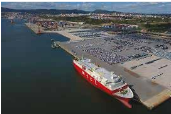
Porto de Setúbal

Setúbal, está localizada na foz do rio Sado, junto à maior praia de areia branca da Europa (65 km) e de notáveis infraestruturas de lazer – Troia e Comporta. Usufrua de um país seguro com um ambiente social amigável, com um clima mediterrâneo, com 3.000 horas de sol por ano, excelentes infraestruturas de saúde e educação, incluindo escolas internacionais.